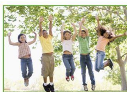
3 - Ambiente