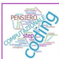
4 - Informatica