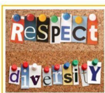
2 - Civismo