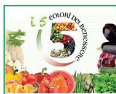
1 - Alimentazione

Le quattro sedi della scuola Primaria di Pietra Ligure, Borgio Verezzi, Giustenice e Tovo S. G. dell'Istituto Comprensivo di Pietra Ligure sono rimaste aperte dal 14 al 28 giugno 2019 per venire incontro alle famiglie che lavorano offrendo un servizio completamente gratuito di alto livello grazie ai finanziamenti europei.