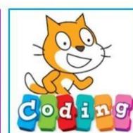
6 - Informatica

A Seguire Tutti i Progetti PON dell'a. s. 2018/2019 grazie ai quali la scuola ha proposto approcci innovativi con i finanziamenti europei per 108.974 euro sia alla Scuola Primaria che Secondaria di 1° grado.